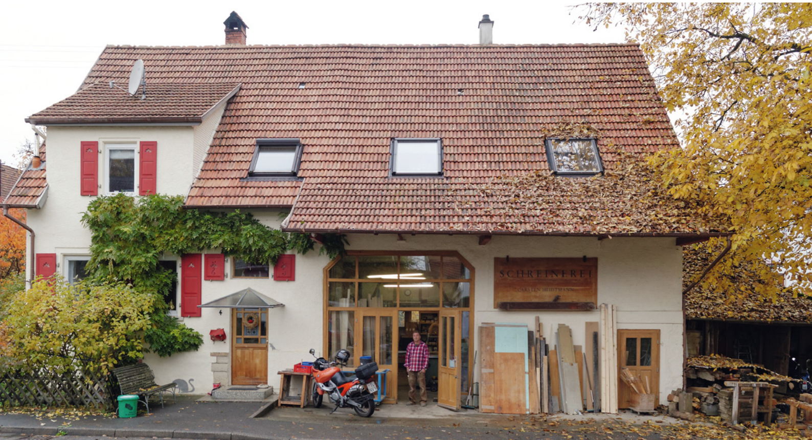
Wohnhaus der Familie Heidtmann mit Schreinerwerkstatt im ehemaligen Kuhstall