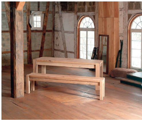
... rustikale Tische und Bänke aus alten, im örtlichen Sägewerk aufgetrennten Holzbalken

werkhaus in der Tübinger Altstadt, und erhielt den Auftrag für die Restaurierung der Fenster, Türen, Böden und sonstiger Holzeinrichtungen. Für die vorbildliche denkmalgerechte Instandsetzung des Gebäudes erhielten die Eigentümer im Jahr 2008 den Denkmalschutzpreis Baden-Württemberg des Schwäbischen Heimatbundes zuerkannt. Für Carsten Heidtmann war das die Eintrittskarte in den Denkmalschutzmarkt.